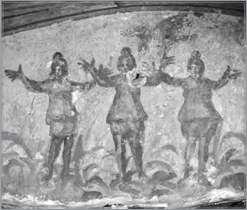
Catacomba Priscilei din Roma, Cei trei tineri din cuptor