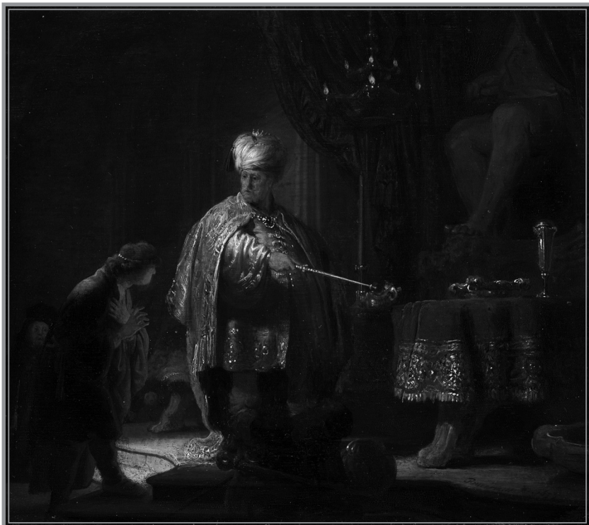
Rembrandt, Daniel și Cir în fața idolului